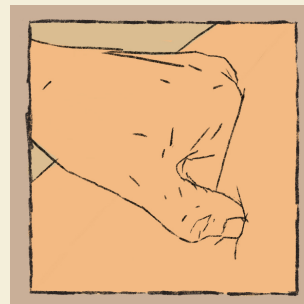
kräftig mit Fingerkuppe