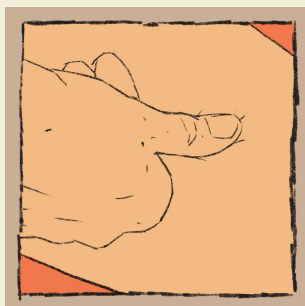
sanft mit Fingerbeere